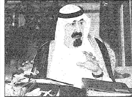
الملك عبدالله متركباً الحاسنة