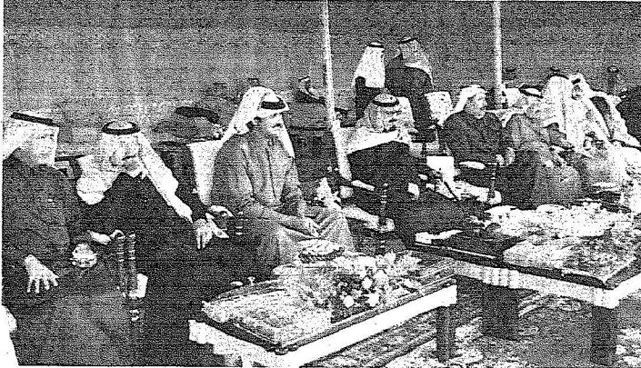
خادم الحرمين الشريفين لدى استقباله ولي العهد القطري.

الداخلية، والدكتور حمد بن عبد العزيز الكواري وزير الثقافة والفنون والتراث، والشيخ فهد بن جاسم آل ثاني وزير الأعمال والتجارة، والشيخ خالد بن خليفة آل ثاني مدير مكتب ولي العهد، وعبد الله بن عبد السلطاني مدير مكتب رئيس مجلس الوزراء وزير الخارجية، وعلي بن عبد الله آل محمود سفير قطر لدى المملكة، والشيخ عبد الرحمن