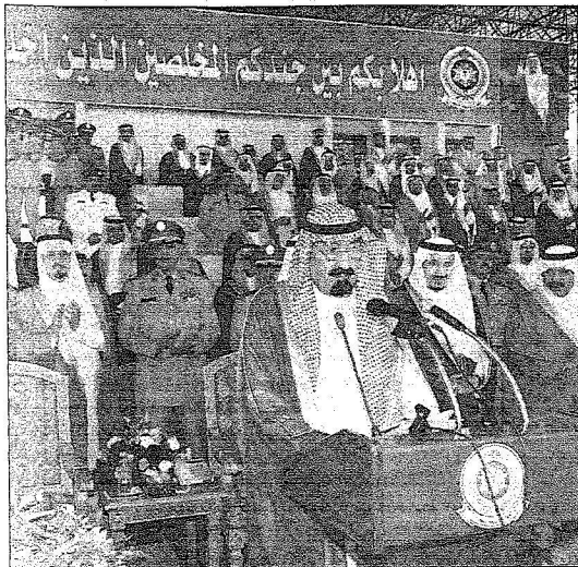
خادم الحرمين الشريفين يلقي كلمة خلال العرض العسكري