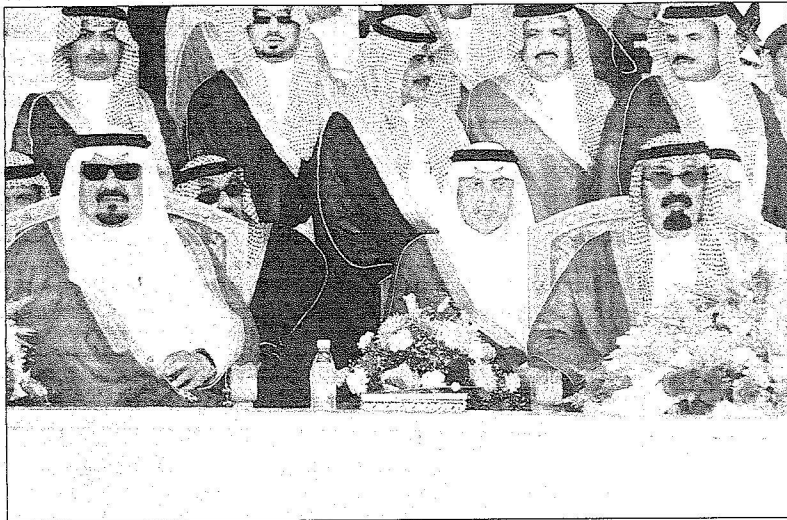
خادم الحرمين الشريفين وولي العهد يتابعان العرض العسكري