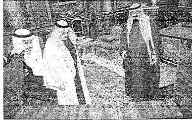
خادم الحرمين الشريفين يطلع على مديرة مجلس وزراء الداخلية العرب

استقبل خادم الحرمين الشريفين الملك عبدالله بن عبدالعزيز آل سعود حفظه الله في مكتبه بالديوان الملكي في قصر اليمامة أسس صاحب السمو الملكي الامير نايف بن عبدالعزيز وزير الداخلية الرئيس الفخري لمجلس وزراء الداخلية العرب يرافقه أمين عام مجلس وزراء الداخلية العرب الدكتور محمد كوسمان الذي تشرف بالسلام