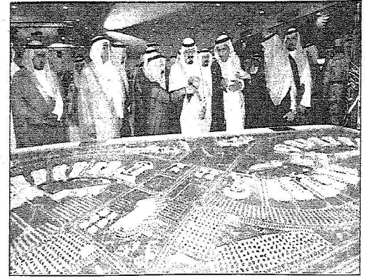
لك الملك الذي يتطلع على مجسمات احد المشاريع

لك الملك الذي دشن مشروع الاسكان التنموي بمؤسسة الملك عبدالله لوالديه بالقرينات ومشروع جمعية الأطفال المعاقين وشركة أسمنت الجوف ومشاريع مؤسسة سليمان الراجحي الخيرية