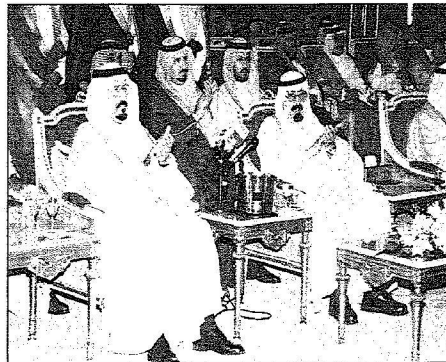
خادم الحرمين وسنوني للحد خلال الاحتفال

المليك المفدى أعطى إشارة البدء فى مشروع سكة الخط الحديدى بتكلفة ٢٠ ملياراً