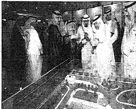
لكه عبدالله يطالع على مشاريع وزارة التجارة