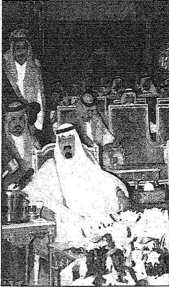
لك عبدالله لحظة تشييد المشاريع