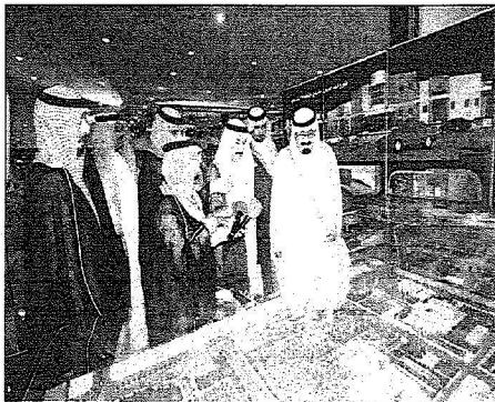
خادم الحرمين يطالع على المشاريع الصحية