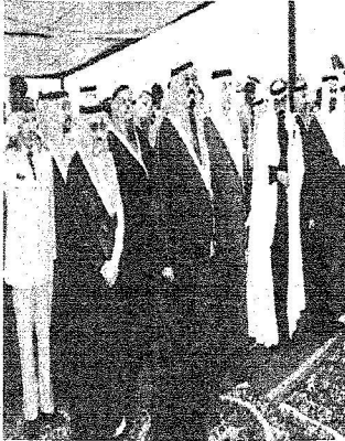
الملك عبدالله .. نعمة شاملة خصصت للكثير للطرق