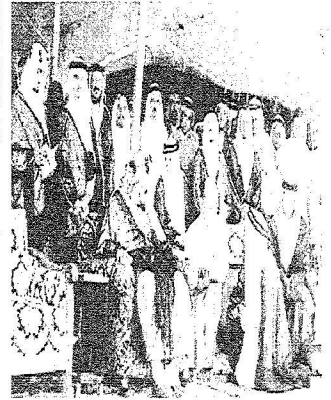
الملك المؤسس عبدالعزيز رحمه الله في بدايات أعمال الطرق

بلغت أطوال الطرق المسفلتة عام ١٣٩٥هـ نحو ١٢٢٠٠ وزادت إلى ٤٦٥١٠ عام ١٤٢٦هـ