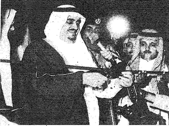
الملك فهد رحمه الله يفتتح طريق الطائف/أبها/جازان