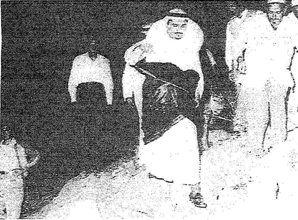
الأمير سلطان يتفقد طريق الهدا