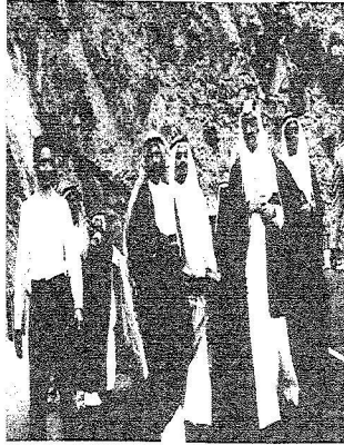
الملك فيصل رحمه الله يتفقد احد الطرق