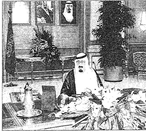
خادم الحرمين الشريفين خلال ترؤسه جلسة مجلس الوزراء أمس

أوضح وزير الثقافة والإعلام أياد بن أمين مدني في بيانه لوكالة الأنباء السعودية عقب الجلسة أن المجلس أكد في هذا السياق على أهمية متابعة ما سرته قصة الرياض من أطر وخطوات للعمل العربي المشترك وعلى ضرورة أن يكون للجامعة العربية دور محوري فيما يخص الساحة الفلسطينية وعلى وجه الخصوص تنفيذ قرار مجلس الجامعة الأخير بإرسال لجنة لتقصي الحقائق وكذلك العمل على استقرار الوضع في لبنان ودعم استقلال قراره الوطني والتأكيد على عروبة وحدة العراق وخصامه مما يمر به من عنف وتفرق واقتتال