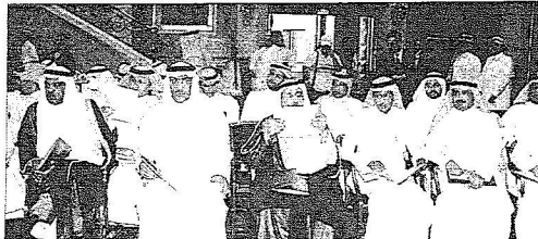
الاعلاميون في اللقاء