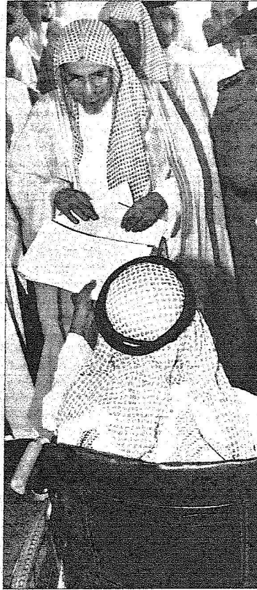
.. ويتسلم معروضاً من أحد ذوي الاحتياجات الخاصة

× رافق رئيس مجلس القضاء الأعلى في جلته وكيل وزارة العدل الدكتور عبدالله الجحفي وعدد من مسؤولي مجلس القضاء الأعلى ومسؤولي وزارة العدل.