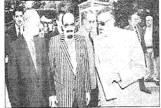
لقطات من تعريف خادم الحرمين الشريفين لسباق الفروسية في ميدان نادي فرانس قلوب في مقاطعة سان كلو الباريسية