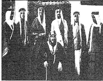
من اليمين إلى اليسار: الأمراء بندر بن عبدالعزيز، عبدالحسن بن عبدالعزيز، منصور بن عبدالعزيز، ناصر بن عبدالعزيز، مساعد بن عبدالعزيز، سلطان بن عبدالعزيز، يقفون خلف الملك فهد رحمه الله

يتواصل الحديث اليوم عن منطقة قصر الحكم للمنطقة التي تحوي في عفاصرها العديد من الأماكن والأحداث والدلالات التاريخية للدولة السعودية، والحياة القديمة والتقليدية التي تجسدها الصور والوثائق التي تنتشر بعضها للمرة الأولى عن تكريات المكان الأبرن في الرياض.. (قصر الحكم)، وعن جانب هام في الحياة الاجتماعية والتعريفية للأسرة المالكة دال سعودي ومن عاش منهن في هذا القصر، وذلك مع المؤرخ والأديب الأستاذ عبدالرحمن بن سليمان الرويشد، الذي يعد أحد المراجع المهمة مثل هذه المتابعات والنوادر التاريخية من خلال ذاكرته وأرشيفه الذي يحوي صوراً ووثائق نادرة تواصل طرحها اليوم لتنتشر أبرز الشخصيات الذين عاشوا في قصر الحكم.