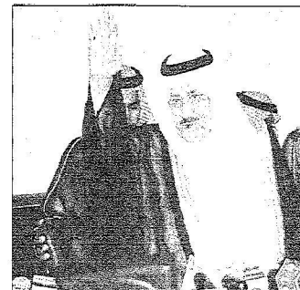
الأمير نايف يحيي الحضور

جدة، أحمد حمدان، وليد العمير، واسن - تصويبي ناصي محسن ، واس :