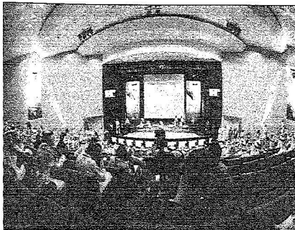
بنو إمامة للاحتفال

المرأة مواطنة مثك الرجل .. تؤدي الكثير للمجتمع .. ولا بد أن تشارك بالعمل بما يليق بها