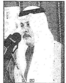
رئيس الحملة يعان لانتقالها من لرياض أسس