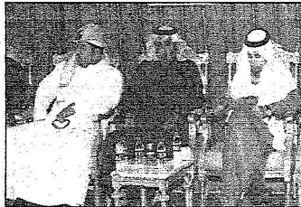
جانب من حضور الحل

البكر: عملنا ليل نهار لسرعة تسيير الجسر البري الرشودي خير هذه البلاد شمل كل الدول الإسلامية.. واللجنة ماضية في مهمتها الإنسانية