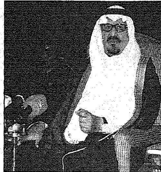
سمو ولي العهد بلقي كمت خلال الحفل