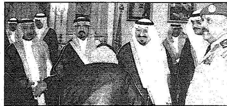
الأمير سلطان خلال استقباله المشايخ والأعيان والأهالي