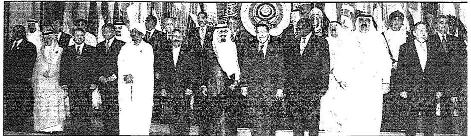
خادم الحرمين الشريفين مع أعضاء الوفد السعودي في العاصمة