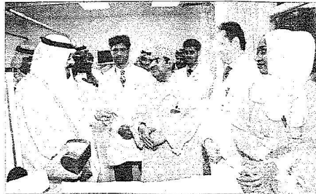
ويتحدث مع والد السيامي العماني