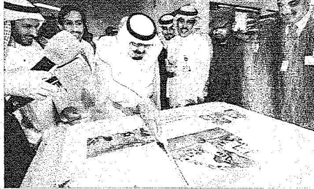
..ويشارك الفريق الطبي نجاحاته

ثم اطلع الملك المفدى على طاولة العمليات التي تم ابتكارها وتصنيعها في مدينة الملك عبدالعزيز الطبية للحرس الوطني لتلائم ظروف عملية فصل التوائم السياميتين العمائيتين وذلك كون اشتباههما كان بمنطقة حساسة وجديدة على أعضاء الفريق الطبي وهي منطقة الرأس. بعد ذلك قام خادم الحرمين الشريفين بزيارة أبوية للطفل عبدالعزيز الذي يعاني من فشل كلوي واطمان حفظه الله على صحته متمنيا له الشفاء العاجل. وقد أعرب المدير التنفيذي للشؤون الصحية بالحرس الوطني باسمه ونياية عن منسوبي الشؤون الصحية بالحرس الوطني عن عظيم شكره وتقديره لزيارة ملك الإنسانية الميمونة التي تؤكد الابوة الحانية والشعور الانساني النبيل الذي يحمله