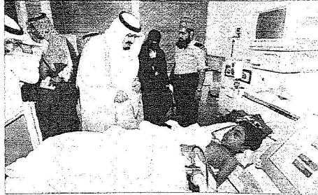
..ويطمئن على طفل يعاني من الفشل الكلوي