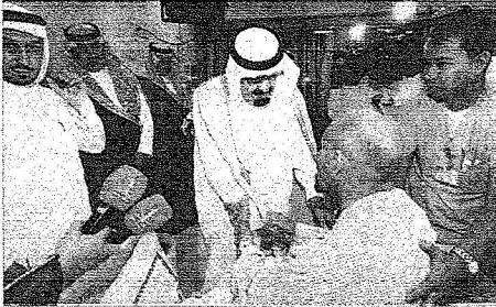
.. ويزور أمير الفوج السادس بالبحرس الوطني