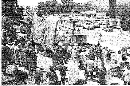
الرحام لحظة توزيع المساعدات السعودية