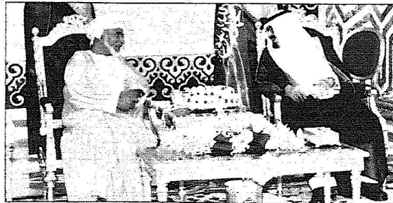
حديث بين الملك عبدالله وفضيلة السلطان قابوس في صالة التشریفات بالمطار

ويضم الوفد الرسمي المرافق لجلالة سلطان عمان معالي وزير ديوان البلاط السلطاني علي بن حوحو البوسعيدی، ومعالي وزير المتكرب السلطاني الغریق أول علي بن ماجد المعمری، ومُغالي الوزير المسؤول عن الشؤون الخارجية يوسف بن علوي بن عبدالله، ومعالي وزير الاقتصاد الوطني المشرف على وزارة المالية أحمد بن عبدالنبي مكي، ومعالي وزير التجارة والصناعة مقبول بن علي بن سلطان، وسفير سلطنة عمان المقيم لدى المملكة الدكتور أحمد بن هلال البوسعيدی.