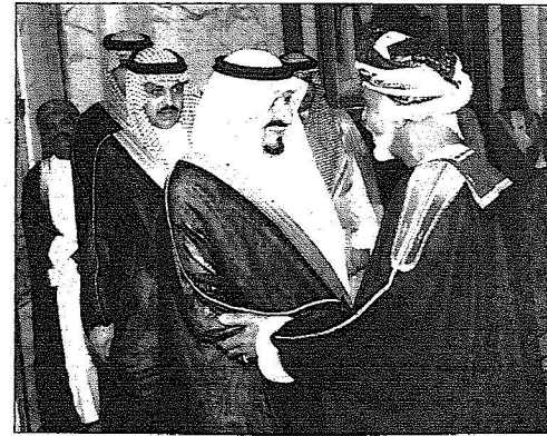
الأمير سلطان مستقبلاً سلطان عمان خلال حفل العشاء..