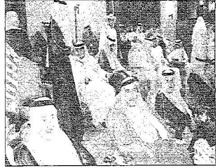
مستشار وزير الثقافة ومحافظ الغاط يباركاز فرات المهرجان