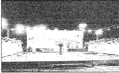
جانب من المحاورة