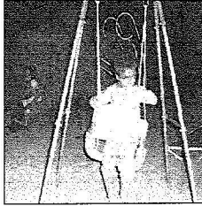
بين سعد بحلم بالعودة للدراسة

وفي سياق التطورات الأخيرة لخدمات المخيم أوضح الحويطي بأنه يجري حالياً الإعداد لمرسة متقلة متصل قريباً إليه ليواصل الطلاب والطالبات تحصيلهم الدراسي، كما سيتم مضاعفة أعداد دورات المياه التي تجاوزت (١٨) دورة حتى الآن لتكون موازنة لأعداد التازحين، مشيراً لاستبدال مكبات المخيم (الصحراروية) بأخرى متطورة نظراً لارتفاع معدل الرطوبة، مشدداً على الخدمات الأساسية المعيشية والصحية، والتنوعية، والإرشادية وغيرها تعد تونوجية.