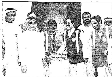
وزير الصحة د. المانع يضع حجر الأساس للبرج الطبي بمستشفى الملك عبدالعزيز بمكة المكرمة

مستشفى الملك عبدالعزيز على مساحة ستة آلاف متر مربع وبتكلفة إجمالية أكثر من مائة وخمسة ملايين ريال. وقال إن هذا تحقق بفضل الله ثم بدعم حكومة خادم الحرمين الشريفين وولي عهده الأمين وبمناخية من صاحب السمو الملكي الأمير خالد الفيصل أمير منطقة مكة المكرمة وجود معالي وزير الصحة.