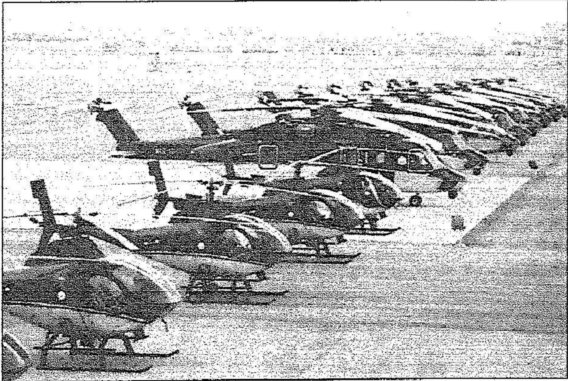
طائرات عمومية جاهزة للتدخل السريع والمسح الجوي للمشاعر