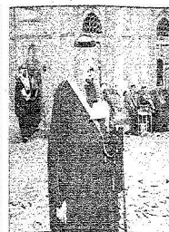
الأمير عبد العزيز