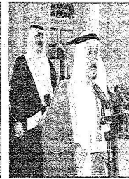
الأمير فيصل بن تركي