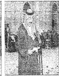
الأمير محمد بن ناصر