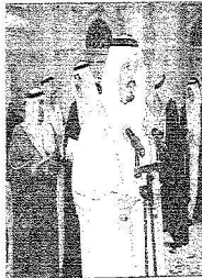
الأمير فيصل بن خالد