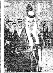
الأمير فهد بن سلطان