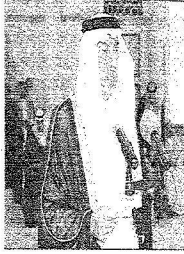
الأمير خالد بن فيصل