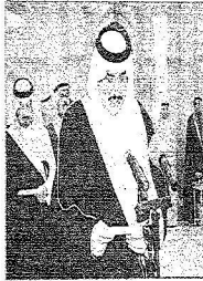
الأمير محمد بن فهد