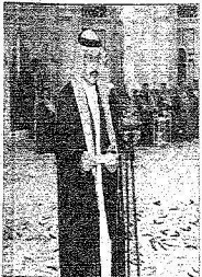
الأمير فيصل بن محمد بن عبدالعزيز