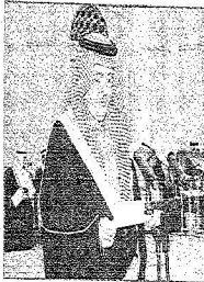
الأمير عبد الله