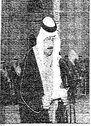
الأمير تركي بن فيصل بن فهد آل سعود