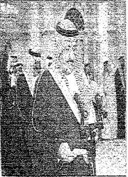
الأمير فهد بن سلطان