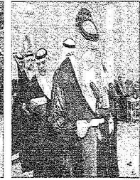
الأمير فيصل بن منصور