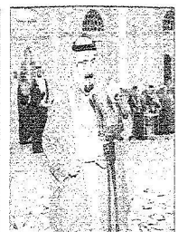
الأمير مشعل بن فهد بن عبدالعزيز