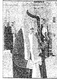
الأمير محمد بن سعود