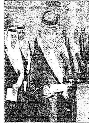
الأمير محمد بن شريف