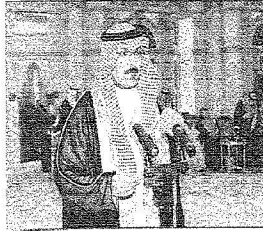
خالد التويجري الأمين العام

عبدالعزیز بن عبدالرحمن الفيصل آل سعود وأبناءه الأبناء التالية أسماؤهم: ١ / صاحب السمو الملكي الأمير مشعل بن عبدالعزيز آل سعود رئيساً. ٢ / صاحب السمو الملكي الأمير عبدالرحمن بن عبدالعزيز آل سعود. ٣ / صاحب السمو الملكي الأمير متعب بن عبدالعزيز آل سعود. ٤ / صاحب السمو الملكي الأمير طلال بن عبدالعزيز آل سعود. ٥ / صاحب السمو الملكي الأمير بدر بن عبدالعزيز آل سعود. ٦ / صاحب السمو الملكي الأمير تركي بن عبدالعزيز آل سعود. ٧ / صاحب السمو الملكي الأمير نايف بن عبدالعزيز آل سعود. ٨ / صاحب السمو الملكي الأمير فواز بن عبدالعزيز آل سعود. ٩ / صاحب السمو الملكي الأمير سلمان بن عبدالعزيز آل سعود. ١٠ / صاحب السمو الملكي الأمير منصور بن عبدالعزيز آل سعود. ١١ / صاحب السمو الملكي الأمير عبداللہ بن عبدالعزيز آل سعود. ١٢ / صاحب السمو الملكي الأمير سطاتم بن