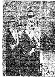
الأمير سعود بن عبدالعزيز