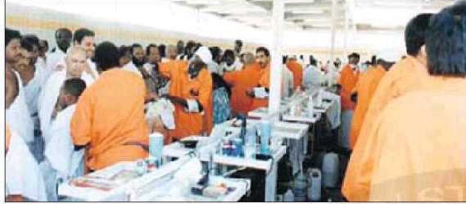
تكثيف المراقبة على كراسي الحلاقة بمشعر منى

وفي مجال النظافة يجري العمل على مدار 24 ساعة في المناطق المزدحمة وذلك بنظام الورديات المتداخلة ، كما تمت زيادة أعداد العمالة لتصبح أكثر من 7 الاف عامل مجهزين بحوالي 670 معدة في مكة المكرمة وتم تخصيص فرق مركزية لمواجهة أي حالات طوارئ كالأمطار أو الحرائق أو لدعم أي منطقة في حالة الحاجة ، كما يتم استخدام 200 صندوق كهربائي ضاغط للنفايات يتم تفريغها باستخدام السحابت ، وفي المشاعر المقدسة تم تخصيص أكثر من 6 الاف عامل وحوالي 620 معدة مختلفة وسيتم العمل على مدار 24 ساعة في أيام الذروة ودعمهم بمراقبين ومشرفين في تلك الفترة وأيضاً بالمعدات اللازمة مثل الشفاطات والمكانس