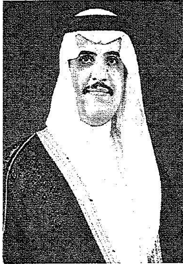
الأمير محمد بن فهد