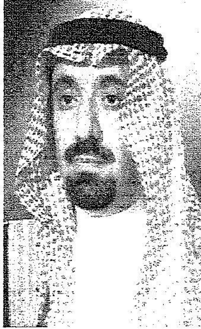
الأمير جفوي بن سعود