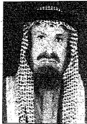
محمد بن فهد