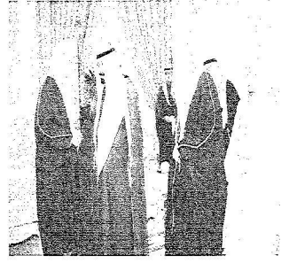
الملك يلتقي الأمراء والعلماء