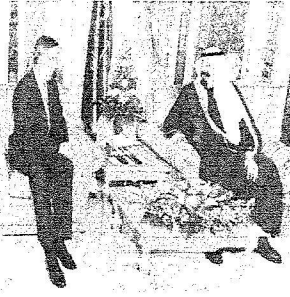
ويتسلم رسالة الرئيس الأمريكي