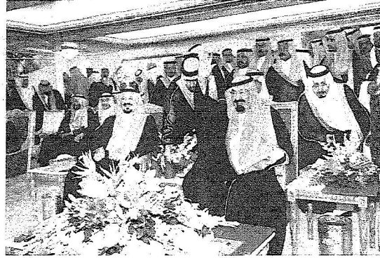
Ⓜ أيها - منصور عثمان - عبدالله الهاجري

شرف خادم الحرمين الشريفين الملك عبد الله بن عبد العزيز آل سعود (حفظه الله) مساء أمس الأول بحضور صاحب السمو الملكي الأمير سلطان بن عبد العزيز ولي العهد نائب رئيس مجلس الوزراء وزير الدفاع والطيران والمفتش العام الحفل الكبير الذي أقامه أهالي منطقة عسير احتفاءً بقدومه الميمون للمنطقة وذلك في الاستاد الرياضي بمدينة الأمير سلطان بن عبدالعزيز الرياضية بالمحالة بأبها إضافة إلى احتفالات محافظة بيشة والنماص ومحافظات عسير ونهران الجنوب التي كان يتم نقلها عبر الإقمار الصناعية على الهواء مباشرة إلى مقر الحفل الرئيسي بأبها.