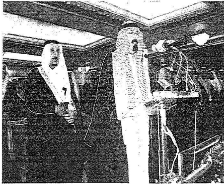
والإنسانية والأبوة الصادقة).