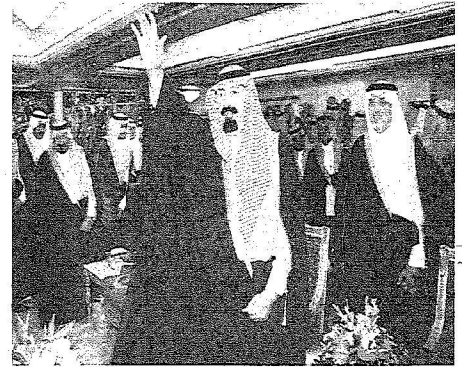
خادم الحرمين الشريفين لدى تشريفه حفل أهالي عسير