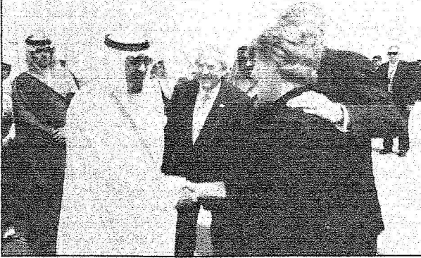
للملك عبدالله يصفاح أعضاء الوفد العراقي ليوش