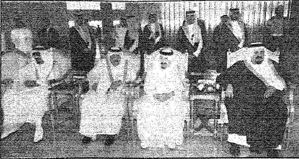
أصحاب السمو الملكي الأمراء خلال استقبال خادم الحرمين للرئيس الأمريكي