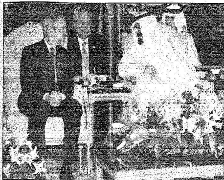
خادم الحرمين والرئيس الأمريكي في صلاة الضحى (واس)