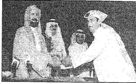
معاليه بحرم الوهباء، يشرح بتكاري

بتوجيه من معالي الوزير على عقد هذا اللقاء الإلكتروني بغية تحقيق جملة من الأهداف التي تهدف لنشر ثقافة التعليم الإلكتروني وبين أنه تم اعتماد عشرين بحثاً لهذا اللقاء ضمن أوراق العمل المقدمة، بالإضافة لعقد (٦) ورش تدريبية بشأن الوظائف التعليمية بالإضافة إلى العرض المصاحب لعدد من المؤسسات التعليمية والشركات المستهدفة وتجهيزات وبرامج التعليم الإلكتروني وتم انشاء موقع إلكتروني