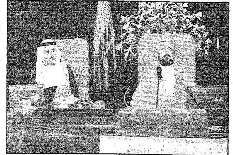
وزير التربية والتعليم الدكتور الديان أثناء الحفل