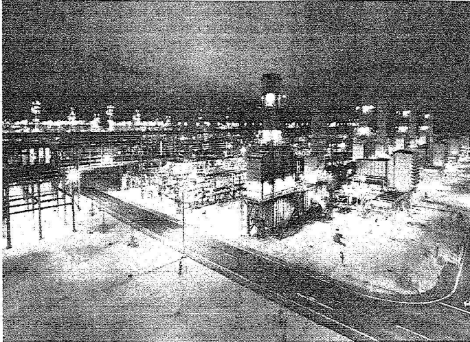
وتمتلك ربع الاحتياطي العالمي من الزيت