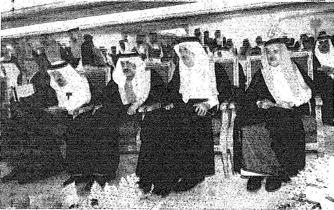
أصحاب السمو الأمراء أثناء الحفل