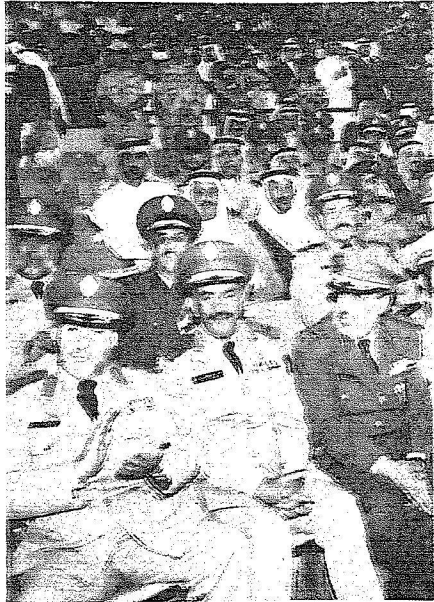
جانب من الحضور في العطل