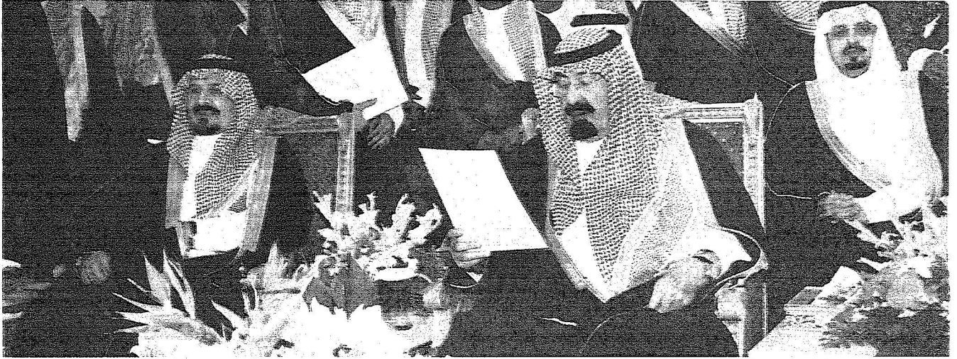
الملك عبدالله يلقى كلمة مؤثرة أشاد فيها بمواقف أهالي عسير