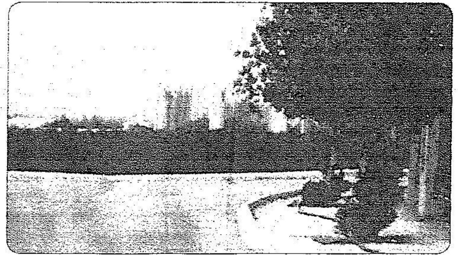
منتزه بوابة مكة متى يعود لاستقبال المواطنين ؟