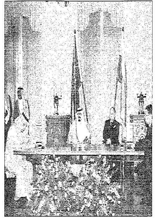
الأمير سعود الفيصل يوقع مع وزير الداخلية البولندي الاتفاقية الأمنية