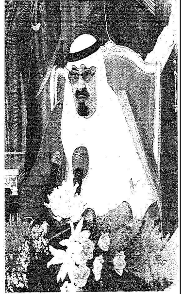
خادم الحرمين الشريفين يتخذ لوفدي عسير والخرج