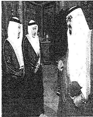
..ويستقبل السفراء الجدد