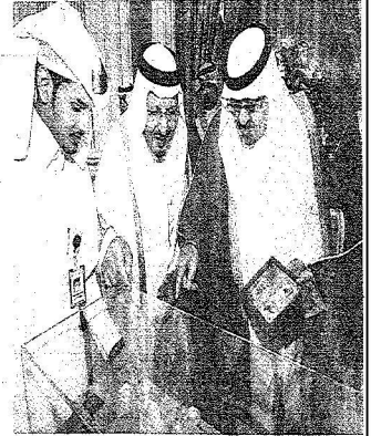
..ويسلم هدية من محافظ الخرج