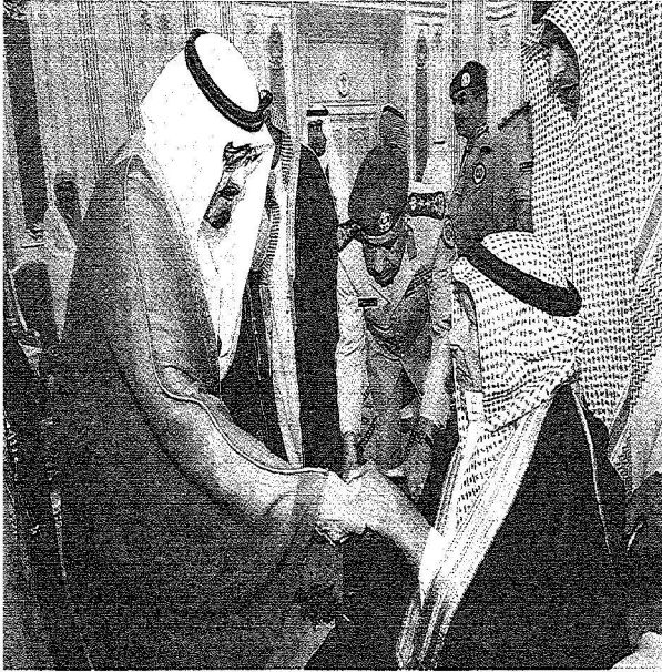
..ويصك بيد أحد كبار السن