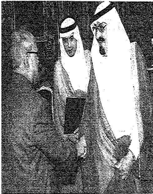
..وزیر الخارجية الهندي