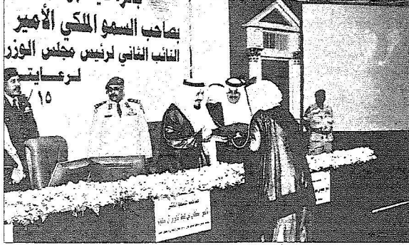
الأمير سلطان لدى رعايته الحفل الأول للجائزة عام 2005