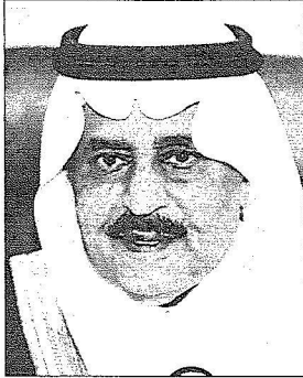
الأمير نايف بن عبد العزيز