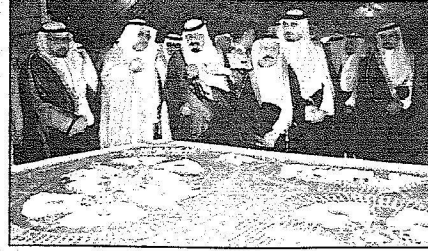
خادم الحرمين خلال جولته في المعرض المصاحب

حكومية مملوكة بالكامل للدولة مشيراً إلى أن من أهدافها تطوير مشروعات صناعة التعدين وتنمية المجتمعات المحلية وتشجيع مصانع الدخل في المملكة. وأشار أن برامج الحفر والبرامج التكنولوجية الاختبارية تحتاج إلى إيجاد مناطق تعدينية واعدة في الجلاميد