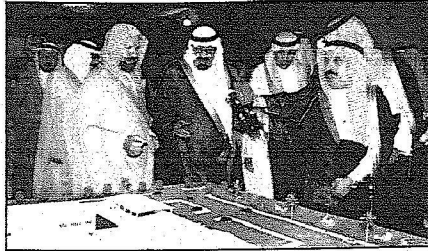
خادم الحرمين يطع على مجسم لأحد مشروعات وزارة للتربية

حضر الحقل صاحب السمو الملكي الأمير عبدالرحمن بن عبدالعزيز نائب وزير الدفاع والطيران والمفتش العام وصاحب السمو الملكي الأمير متعب بن عبدالعزيز وزير الشؤون البلدية والقروية وصاحب السمو الأمير عبدالله بن محمد بن عبدالعزيز آل سعود وصاحب السمو الملكي الأمين نايف بن عبدالعزيز وزير الداخلية وصاحب السمو الأمير فيصل بن تركي بن عبدالعزيز آل سعود وصاحب السمو الأمير عبدالله بن مساعد بن عبدالرحمن وصاحب السمو الملكي الأمير مقرن بن عبدالعزيز رئيس الاستخبارات العامة واصحاب السمو الملكي الامراء واصحاب المغالي الوزراء وكبار المسؤولين من مدنيين وعسكريين.