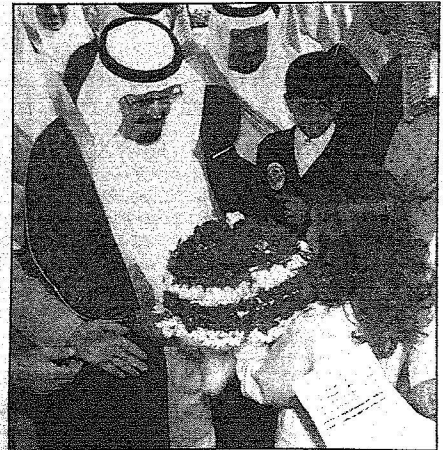
الملك عبدالله وسلم بالقة من اللورد قمعتها منطقة خلال الحفل

ثلاثمئة وخمسين وثلاثين مليون ريال. « وضع الحجر الاساس لمشروع تقاطع مطار عرعر وتقاطع مستشفى