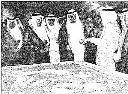
لكل عبدالله يستمع إلى شرح من وزير التعليم العالي عن مشروعات الوزارة في المنطقة