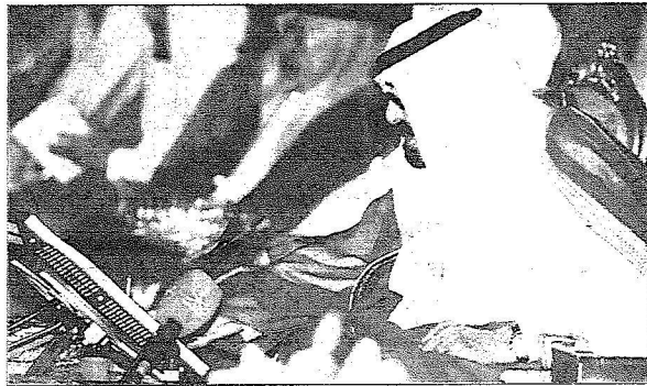
قائد المسيرة يمدن مشاريع الخير في تبوك

تقدماً ونماء وبالأسس القريب كنتم في منطقة الجوف وقبله في منطقة الحدود الشمالية والسيوم في منطقة تبوك تسعدون بلقاء ابنائها وقيتناون بتلمس احتياجاتها وتحقيق مطلباتها».