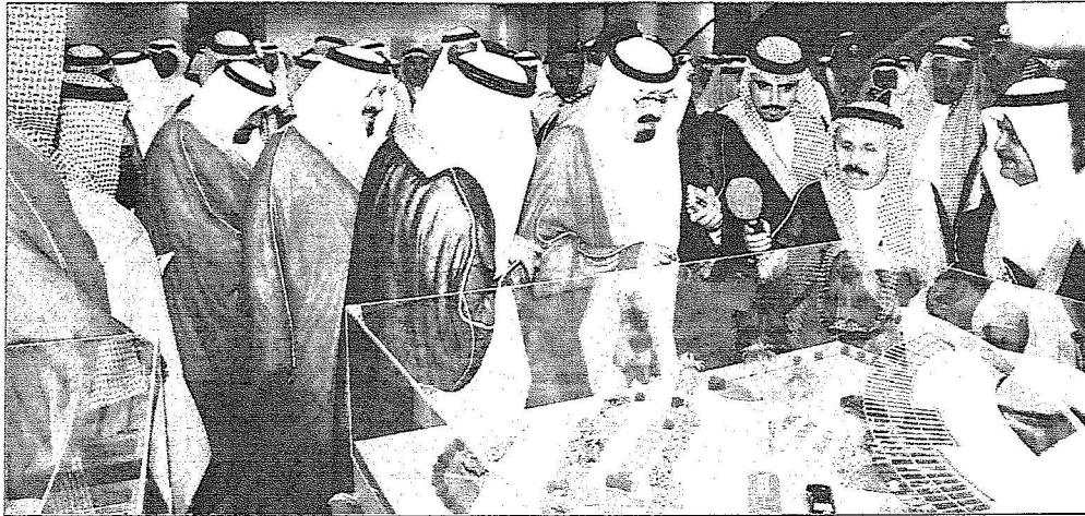
الملك عبدالله يطالع على مجسم جامعة الامير فهد بن سلطان الاحملية

عطا الله المرواني . علي بدير . عبد الرحمن العكيمي (تبوك)