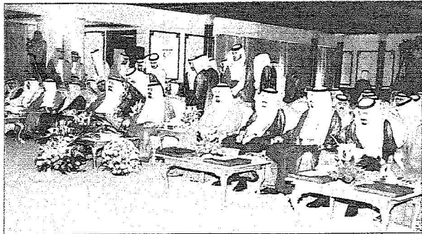
خادم الحرمين الشريفين وولي العهد يتابعان العرض المرئي لمشاريع تبوك

واكد وزير النقل ان منطقة تبوك تحظى بمشاريع طرق يجري تنفيذها حاليا يبلغ اطوالها ١٧١٠ كيلو مترات بتكلفة ١٥٠٠ مليون ريال ومنها ازدواج الجزء الواقع بمنطقة تبوك من طريق ينبع- امالج- الوجه- ضياء- شرما- البدع- الشرف- حقل- الدررة بطول ٦٦٧ كيلو متر بتكلفة ٨٧٢,٤٧٩,٨٢٢ ريالاً وتنفيذ طريق تبوك - شرما بطول ١١٨ كيلو متر وازدواج طريق تبوك- تيماء- المدينة المنورة الحالي الجزء الرابع تيماء- القلبية بطول