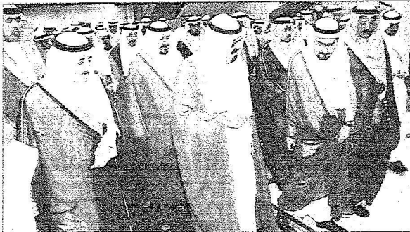
الملك يتحدث الى وزير الثقافة والاعلام

وعد تفخّل خادم الحرمين الشريفين بوضع حجر الأساس لعدد من مشاريع المؤسسة العامة للتعليم الفني والتدريب المهني في منطقة تبوك اكتمالا لمنظومة التعليم والتدريب المهني على امتداد المملكة شاملة تعليمات التقنية والمعاهد العليا التقنية للبنات ومعاهد التدريب المهنية. وقال «ان هذه المنظومة من الكليات والمعاهد ستتيح الفرصة لنحو ٤٥٠ الف متدرب ومتدربة ليحلقوا من مناهل العلوم التحليلية ويأخذوا بأسباب