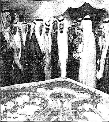
خادم الحرمين الشريفين يشرف على مشروع تطوير المنطقة الحدود الشمالية