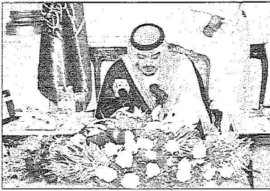
المدينة المنورة مروان عمر قصاص

أكد صاحب السمو الملكي الأمير عبدالعزيز بن ماجد بن عبدالعزيز أمير منطقة المدينة المنورة أنه منذ عهد المؤسس الملك عبدالعزيز - رحمه الله - إلى عهد خادم الحرمين الشريفين الملك عبد الله بن عبدالعزيز - حفظه الله - حظيت المدينة المنورة بعناية خاصة إدارياً من قيادة هذه البلاد المباركة لأهمية المدينة المنورة وقديسيتها ومكانتها الخاصة في قلوب جميع المسلمين.