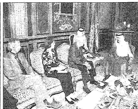
الملك يستقبل الرئيس الأمريكي الأسبق جيمي كارتر