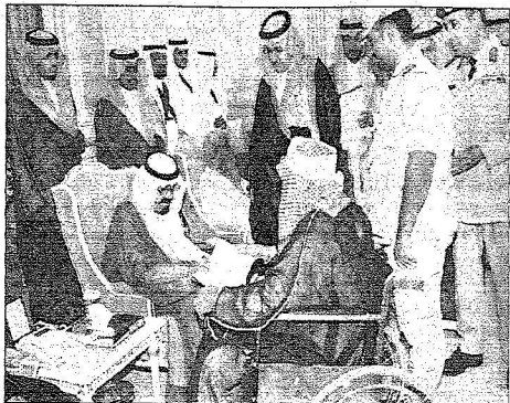
كادم الحرمين الشريفين يستقبل المواطنين