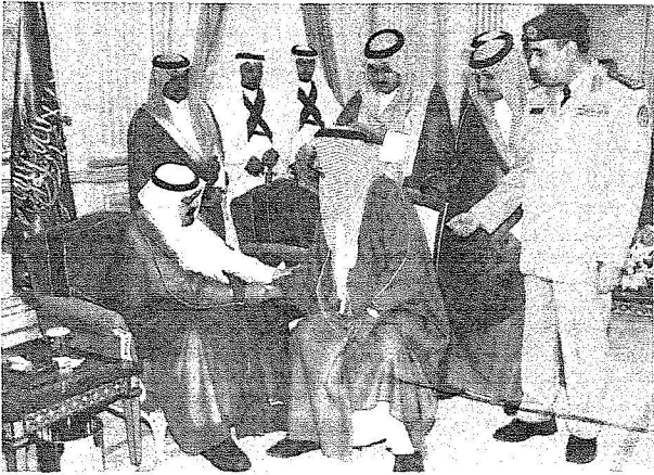
الملك مستقبلاً الأمراء والمسؤولين وجموع المواطنين أمس.