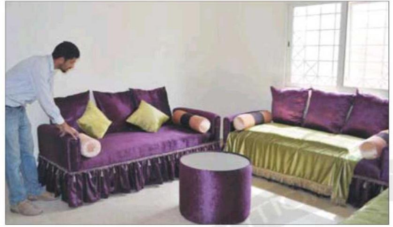
○ أثاث فاخر في الفلل السكنية. ○