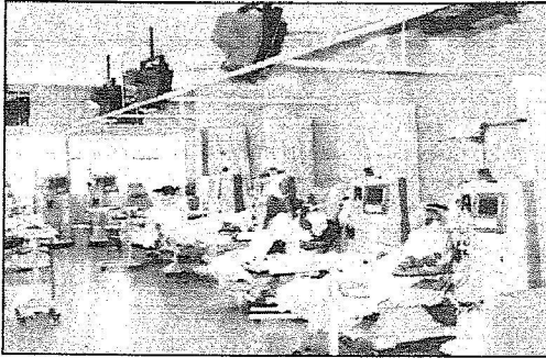
أجهزة حنية لفحص المرضى