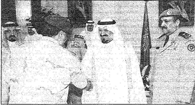
سموه يستقبل قادة وضباط القطاعات العسكرية