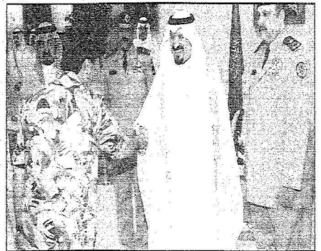
ولي العهد مستقبلاً الملكة لضباط