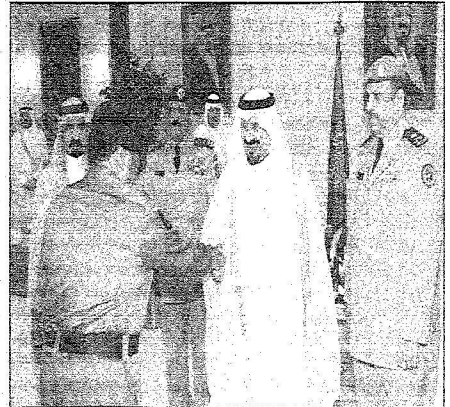
سعود ولي العهد مستقبلاً الملكة وعبار كعبان

استقبال كبار قادة وضباط القطاعات العسكرية المشاركين في موسم الحج