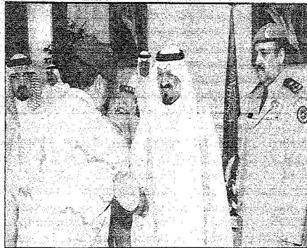
سعود يستقبل قادة وضباط القطاعات العسكرية