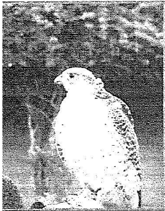
حرم السفير البريطاني السيدة ما

وأعرب السفير البريطاني لدى المملكة عن فخره أنه حتى الآن ٩٥٪ من