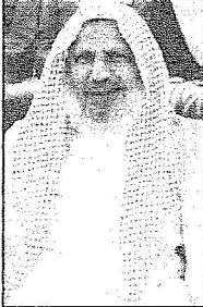
الشيخ عبدالعزیز الفالح

سجادة وودة وتزويد جميع أجزاء الحرم بعدد ٧,٥٠٠ حاظفة مياه من ماء زمزم المبرد وعشرين خزان من ماء زمزم المبرد موزعة في بعض المواقع بالساحات، ويقوم بأعمال السقيا والفرش والنظافة والصيانة عمالة عددها ١,٩٥٠ عاملاً وعاملة وجميع الأعمال تتم وفق خطط وبرامج معدة لموسم شهر رمضان ومنها إدارة خدمات الصيانة