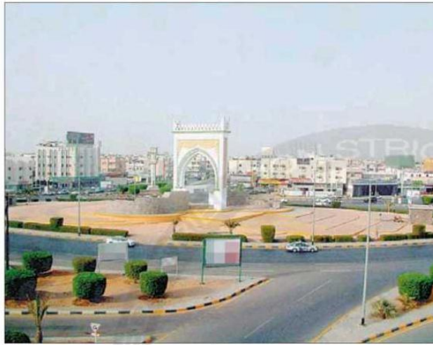
مدخل منطقة جازان.