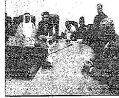
رئيس وزراء مصر، لدى استقباله في السعودية بقميص الصمغ، مع

« قدم رئيس الوزراء المالدي دوله السيد عثمان يوسف ميغا عظيم شكره وتقديره لخادم الحرمين الملك عبدالله بن عبدالعزيز وسمو ولي عهده الأمين على دعم المملكة وموافقتها المشرفة مع حكومة وشعب مالي.. وقال: ليس غريباً على خادم الحرمين الشريفين ما يقدمه تجاه المسلمين في أنحاء العالم وتجاه نشر السلام والعدالة في العالم أجمع وتقديم المساعدات الإغاثية العاجلة للمتضررين بدون تمييز أو منة.