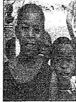
مملكة ملكه عبدالعزيز