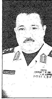
العميد فهد بن عون

والمادية لمنطقتي مكة المكرمة والمدينة المنورة، وتابعت عن كتب كل صغيرة وكبيرة مما يحدث بيناتين المنطقتين حتى وصلنا إلى ما وصلنا إليه اليوم - والله الحمد والشكر - من تطورات هائلة جعلت المسلمين يؤدون مناسكهم ببسرس وسهولة. مشيراً إلى أن ما سعدنا به اليوم من نجاحات كبيرة لم تأت من فراغ؛ فلولاً الجهود الجسام والمقايعة الميدانية المستمرة من لدن خادم الحرمين الشريفين لم يتحقق ما تحقق اليوم، ولكن - الحمد لله - وفق الله هذه البلاد بقيادة حكيمه، سائلاً الله أن يحفظها من كل حادق وحاسد.