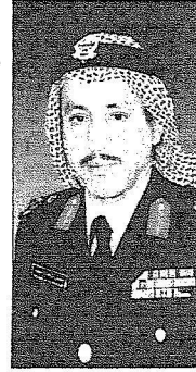
اللواء مساعد الشاهوب