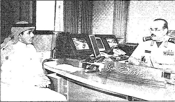
الفريق عبيد بن غيث أثناء حديثه مع الزميل سعود البذلي

في البداية قال مساعد قائد الحرس الملكي وقائد اللواء الخاص الشريفين عبيد بن غيث: إن ما تقوم به هذه البلاد بتوجيه ودعم ومتابعة من لدن خادم الحرمين الشريفين الملك عبد الله بن عبد العزيز شخصياً وأخيه ولي العهد صاحب السمو الملكي الأمير سلطان بن عبد العزيز يمثل تهماً ثابتة لاهتمام هذه البلاد بشؤون المسلمين في كل الأحوال، وخاصة خلال موسم الحج الذي تستقبل خلاله هذه البلاد أكثر من مليوني حاج سنوياً، تضع من خلاله حكومة خادم الحرمين الشريفين - حفظه الله - كل جهودها وإمكاناتها لخدمة ضيوف الرحمن وراحتهم وتوفير كافة خدمات الأمن والأمان وغيرها من الخدمات الأخرى لنهضة الحشود الكبيرة